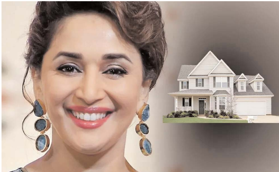
को ही कराया है। उन्होंने इस फ्लैट के लिए 1.07 करोड़ की स्टैप ड्यूटी चुकाई है।

इसी सोसाइटी में रेंट पर रहती हैं माधुरी रिपोर्ट्स के मुताबिक, माधुरी का ये घर 5,384 स्क्वायर फीट में फैला हुआ है। इसके साथ ही इसमें 7 कार पार्किंग स्लॉट भी हैं। कहा जा रहा है उन्होंने इसका रजिस्ट्रेशन 28 सितंबर