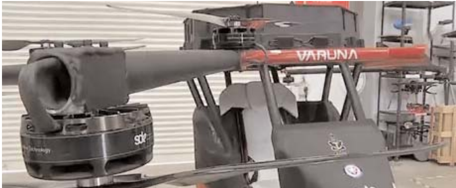
तकनीकी खराबी के बाद भी सुरक्षित लैंडिंग करने में सक्षम है। इसमें एक पैराशूट भी है, जो इमरजेंसी या खराबी के दौरान अपने आप खुल