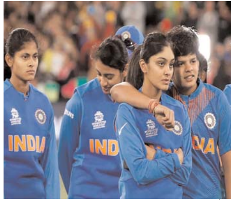
17 वर्ल्ड कप का आयोजन किया जा रहा है। भारतीय टीम पहली बार इस टूर्नामेंट में हिस्सा

11 से 30 अक्टूबर तक देश में होने वाले विमेंस अंडर-17 वर्ल्ड कप के लिए 21 सदस्यीय टीम की घोषणा कर दी गई है। टूर्नामेंट देश के तीन शहरों भुवनेश्वर मुंबई और गोआ में खेला जाएगा। भारत ग्रुप ए में है। इस ग्रुप में यूएसए, मोरक्को और ब्राजील शामिल हैं। भारत का पहला मुकाबला 11 अक्टूबर को अमेरिका के साथ है। जबकि, 14 अक्टूबर को मोरक्को और 17 अक्टूबर को ब्राजील के साथ भिड़ंत होगी। भारत में पहली बार विमेंस अंडर-