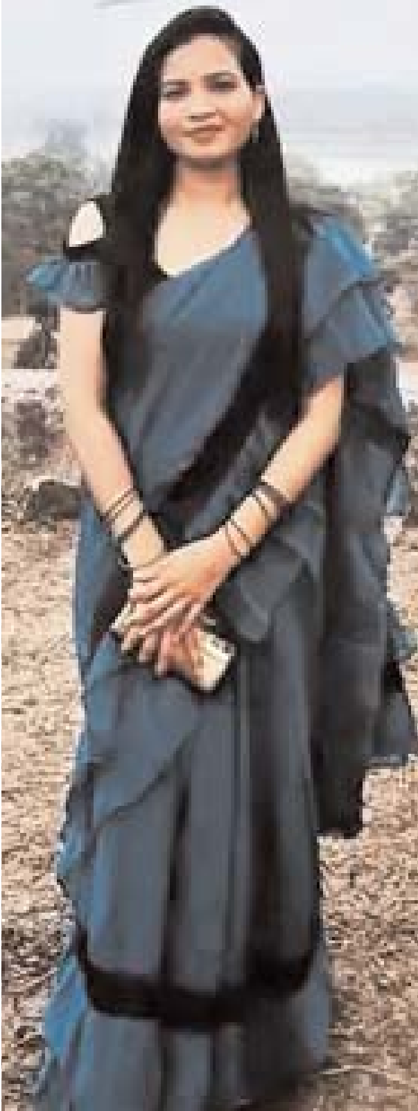
न्यूज क्राइम फाइल

शव घर से 5 किलोमीटर दूर जबलपुर के बांध में फेंका; लापता बताकर नौकरी करता रहा