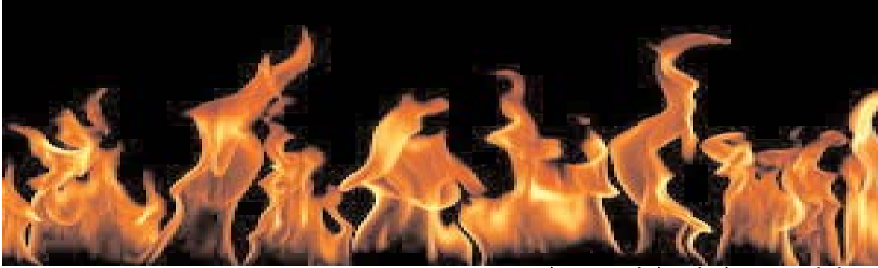
न्यूज क्राइम फाइल

भोपाल-इंदौर हाईवे पर खजूरी क्षेत्र के अय्यापुर गांव के पास शनिवार रात एलपीजी से भरे कैप्सूल टैंकर के केबिन में शार्ट सर्किट से आग लग गई। लपटों से घिरता देख ड्राइवर और क्लीनर टैंकर को सड़क किनारे खड़ा कर दिया और केबिन से कूदकर जान बचाई। राहगीरों ने मामले की सूचना फायर कंट्रोल को कॉल पर दी। सूचना मिलते ही मौके पर पहुंची पुलिस और फायर ब्रिगेड की दमकलों ने आधे घंटे की कड़ी मशकत के बाद आग पर काबू पा लिया। गनीमत रही कि केबिन में लगी आग टैंकर तक नहीं पहुंची नहीं तो बड़ा हादसा हो सकता था। मामले की गंभीरता को देखते हुए पुलिस ने आसपास के रहवासी इलाके को खाली करवा लिया था। आग बुझने के बाद लोगों ने राहत की सांस ली।