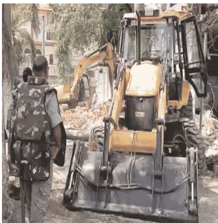
न्यूज़ क्राइम फाइल