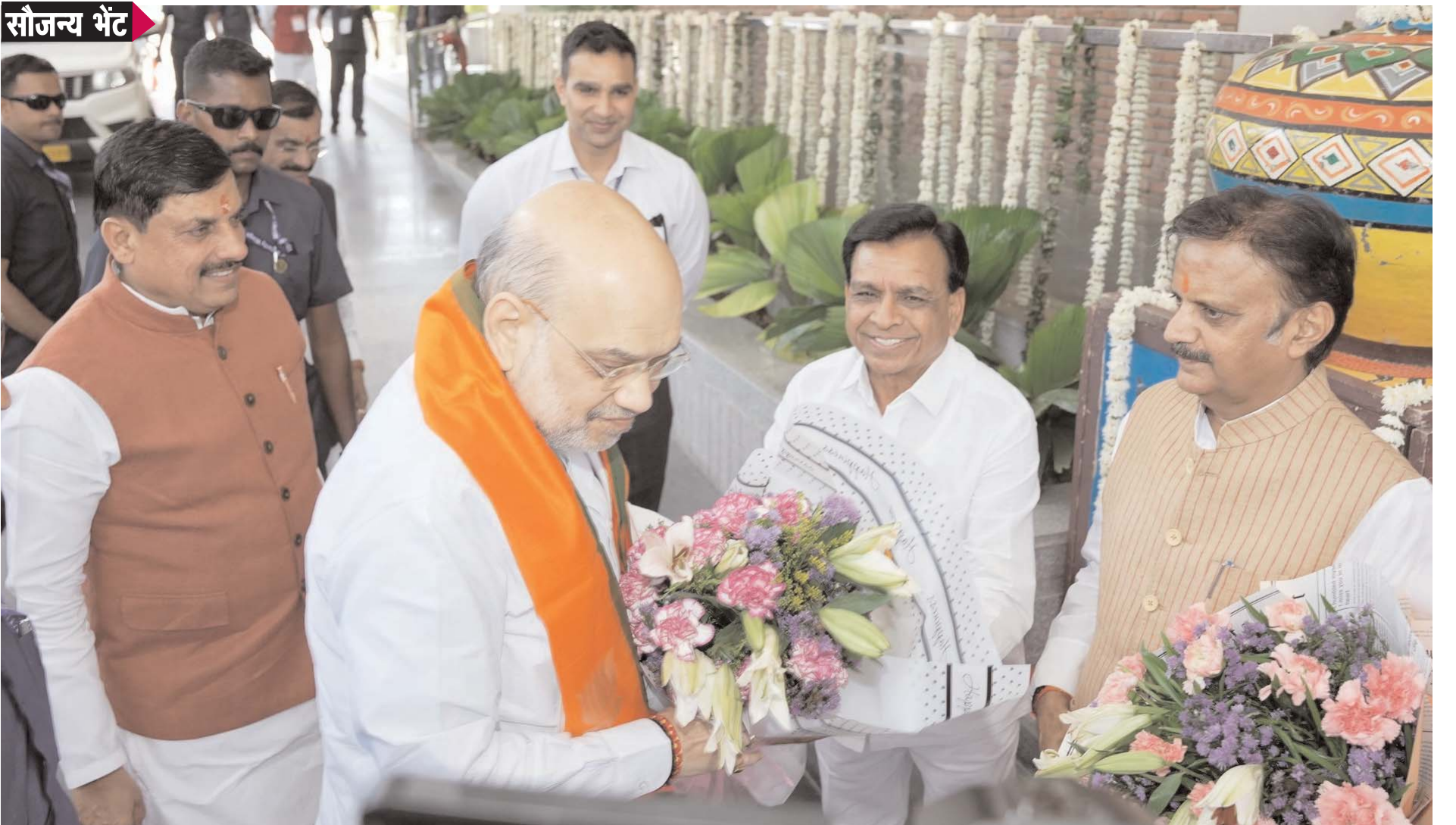
उपमुख्यमंत्री जगदीश देवड़ा ने भोपाल आगमन पर देश के यशस्वी गृह एवं सहकारिता मंत्री माननीय श्री अमित शाह जी मुख्यमंत्री निवास पर आत्मीय स्वागत-अभिनन्दन किया।