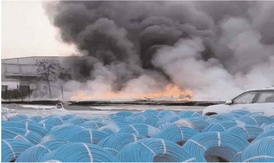
न्यूज क्राइम फाइल

धार में पीथमपुर इंडस्ट्रियल एरिया की कंपनी में लगी आग पर करीब 9 घंटे में काबू पाया जा सका। आग बुझाने में एक हजार लीटर फोम, 25 डंपर रेत और फायर ब्रिगेड की 12 गाड़ियों का पानी लगा। आसपास की फैक्ट्रियों को लपटों से बचाने