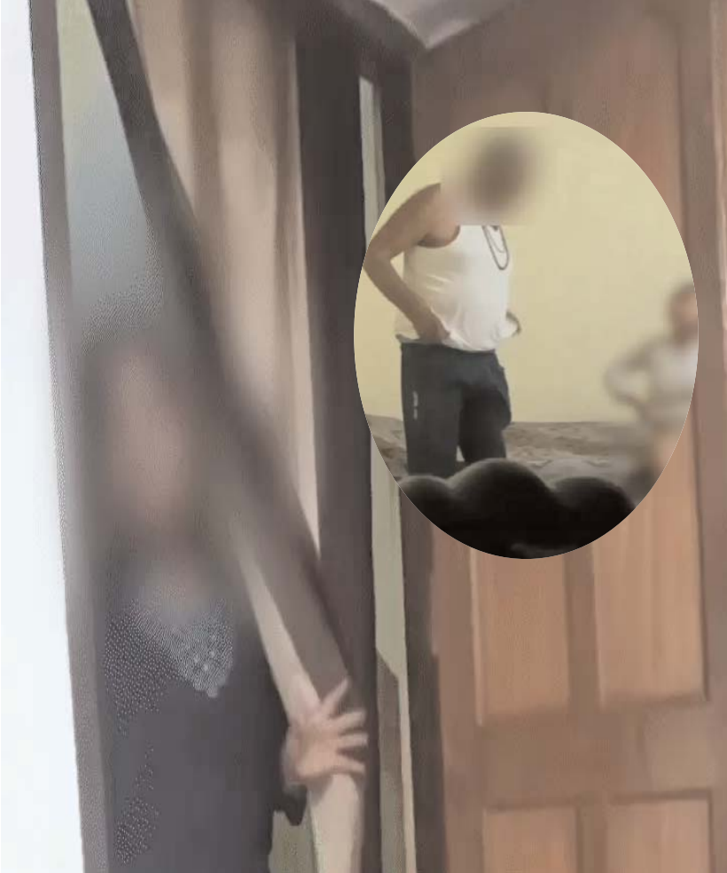
न्यूज क्राइम फाइल

मऊगांज जिले में पूर्व जनपद उपाध्यक्ष का वायरल अश्लील वीडियो असल में हनी ट्रैप निकला है। मामले में पुलिस ने शुक्रवार शाम आरोपी महिला और उसके पति पर एफआईआर दर्ज कर ली है। आरोपियों ने नेता को नशीला पदार्थ देकर आपत्तिजनक वीडियो बनाया और ब्लैकमेल करते हुए 5 लाख रुपए की फिरौती मांगी थी। दोनों आरोपी फरार हैं,